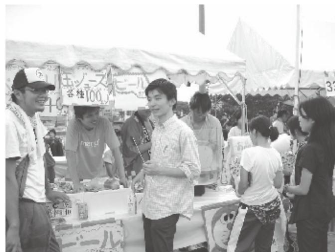
▲生駒市民の夏祭り「どんどこまつり」にビールやジュースの販売で参加しました。