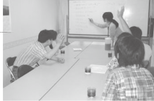
▶「ハイ・ハイ」これからどんなことをしようか? スタッフと一緒にこの活動をする。