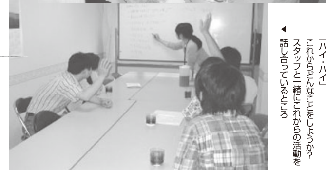
▶「ハイ・ハイ」これからのことをしようか? スタッフと一緒にこれからの活動を話そう!