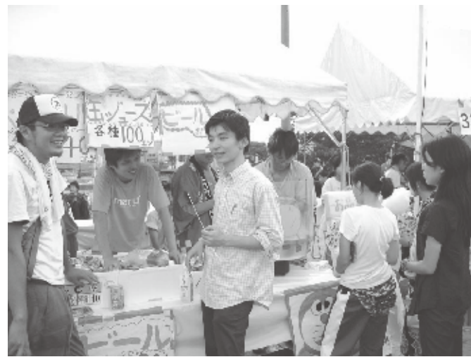
▲生駒市民の夏祭り「どんどこまつり」にビールやジュースの販売で参加しました。