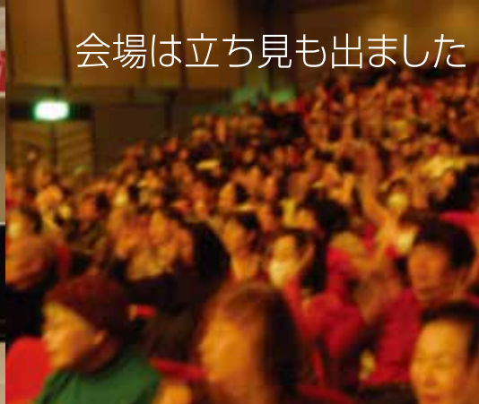
会場は立ち見も出ました

主催／生駒市精神障害者施設後援会(ひだまり後援会)では毎年実行委員会を開き、みんなで楽しく企画しています。皆さんのご意見ご要望をお聞かせください。